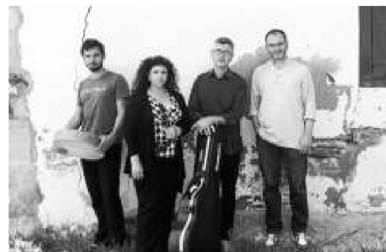
Los componentes del grupo Bidaia.