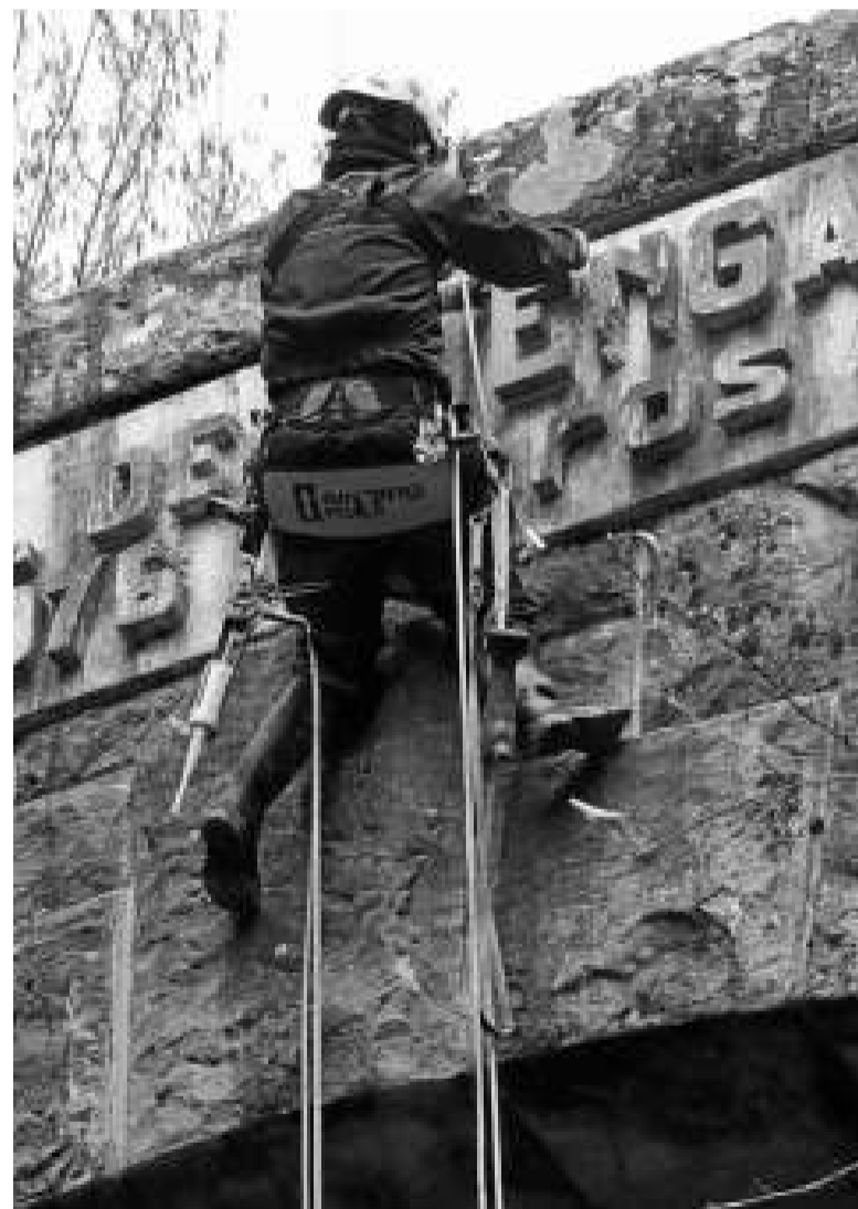
Durante el proceso se reconstruyó la ‘E’ del nombre del túnel.

UN ELEFANTE Una vez dentro, el visitante se encuentra con dos pantallas sincronizadas. En una de ellas, las palabras antes escuchadas se transforman en “fisicidad, emotividad y sentido de duelo” a través de un elefante africano que Poyo llevó hasta el lugar para filmarlo recorriendo el entorno exterior y el interior de esta gruta artificial hoy en ruinas. Para la grabación, empleó distintas cámaras, algunas de infrarrojos y térmicas para captar al animal en la oscuridad del túnel, y también drones. “Se trataba de hablar no solo del espacio físico, sino también psíquico, porque el lugar en sí mismo impresiona; tiene ocho o nueve metros de ancho, siete de alto,