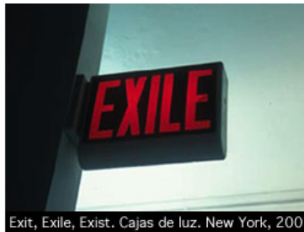
Exit, Exile, Exist. Cajas de luz. New York, 2001

Las disímiles vertientes de estas reflexiones anteriores, se relacionan a su vez con la animación en 3-D Ambientes hostiles (2005), donde apropiándose de elementos cercanos al video dadaísta El retorno a la razón (1920), de Man Ray, y con memorias visuales y temáticas que pudieran resultar también cercanas a The Wall, de Pink Floyd-Alan Parker, permite a Txuspo poner a interactuar clavos, martillos y tablas, que se