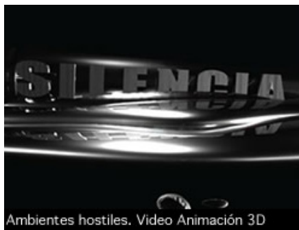
Ambientes hostiles. Video Animación 3D