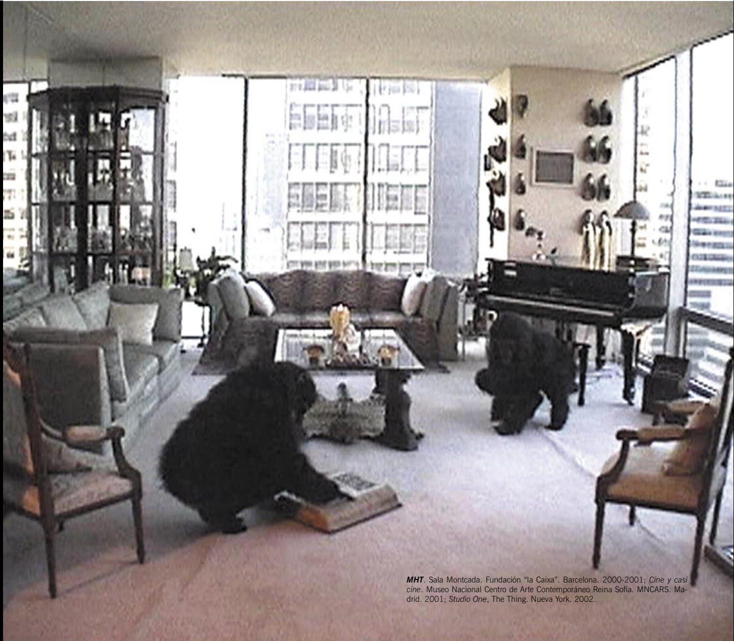
MHT. Sala Montcada. Fundación "la Caixa". Barcelona. 2000-2001; Cine y casi cine. Museo Nacional Centro de Arte Contemporáneo Reina Sofía. MNCARS. Madrid. 2001; Studio One, The Thing. Nueva York. 2002.