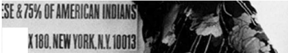
Metrópolis - Yoko Ono